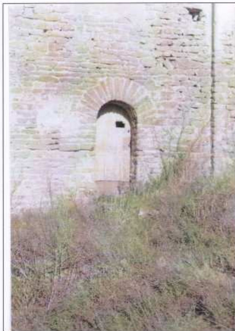
Fig 7 – Porte plein cintre qui s'ouvrait sur la nef de l'église.