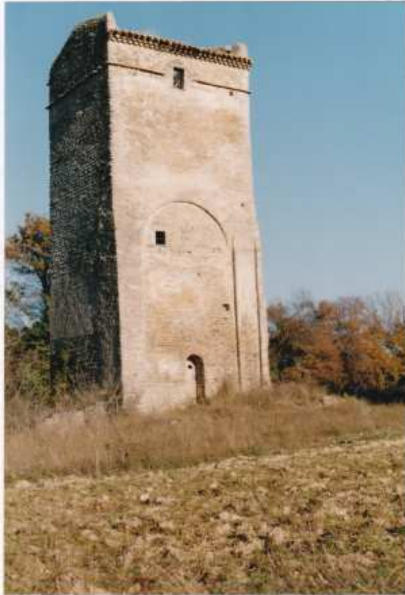
Fig 1. Prieuré du saint Sépulcre et de saint Foule ( pigeonnier de Cazaban).