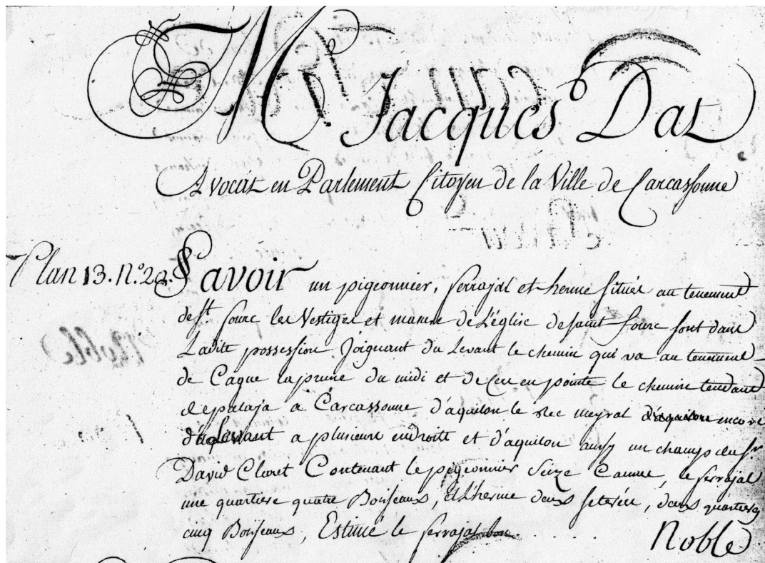
Fig.4- Extrait du compoix communal de 1788.