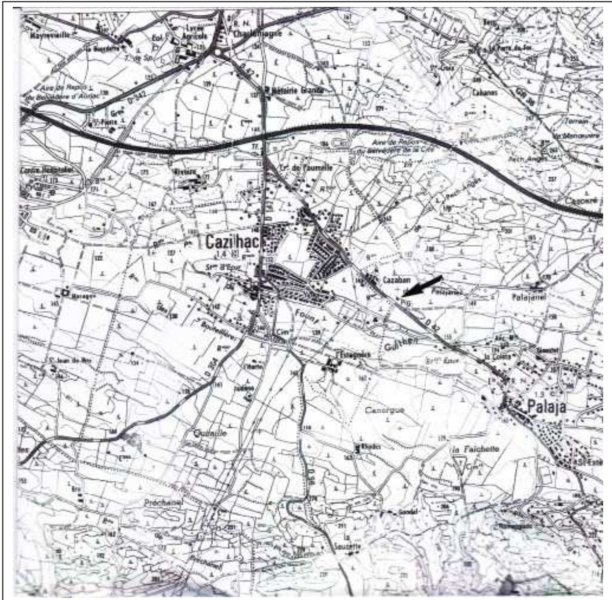
Fig. 2 – Plan au 1 / 125000