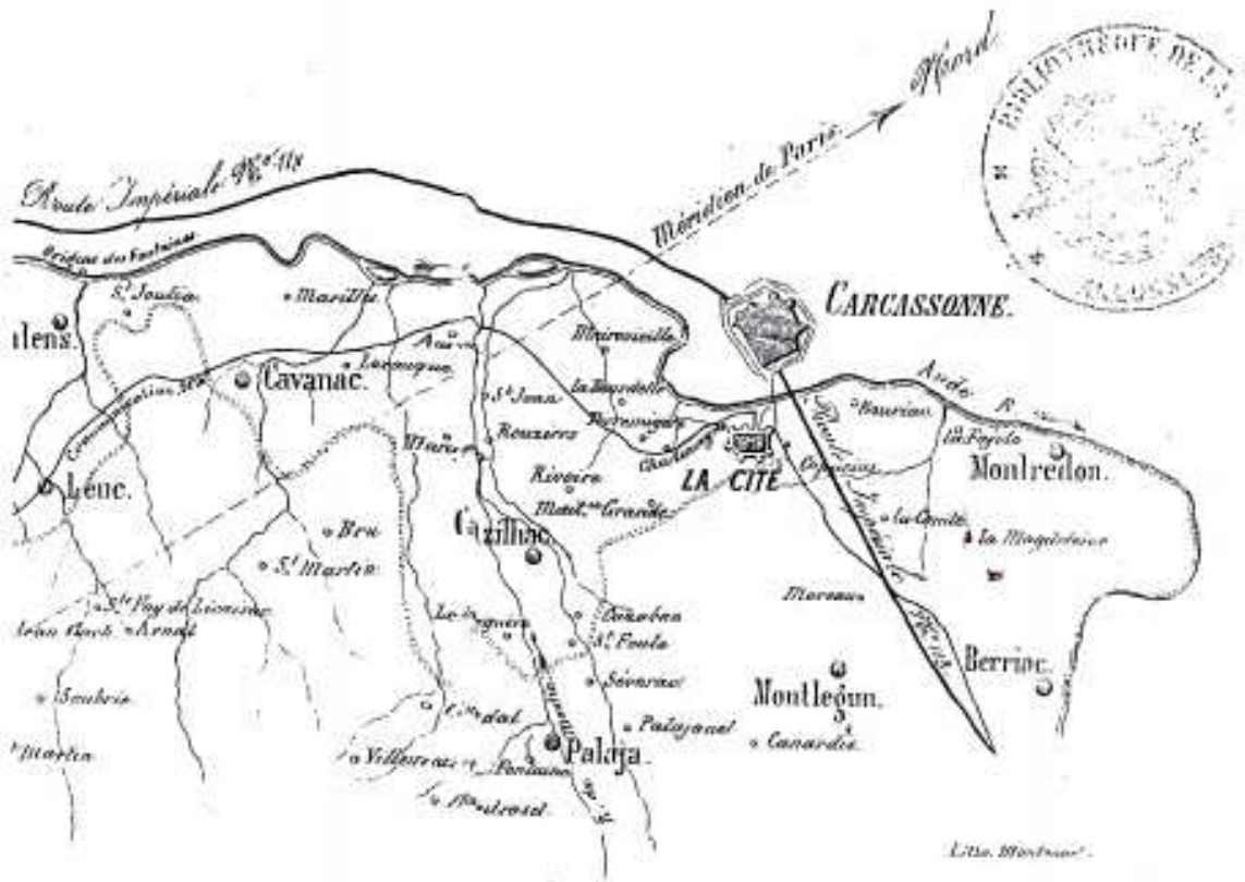
Fig 6 - Carte de M. C. Courtejaire de Décembre 1853