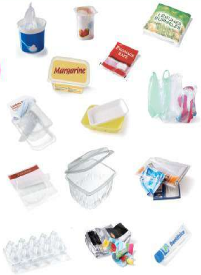
Pots, sacs et films plastiques, barquettes, autres