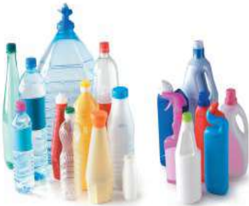
Bouteilles et flacons