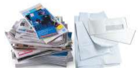
Tous les papiers