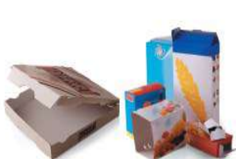
Cartons et cartonnettes