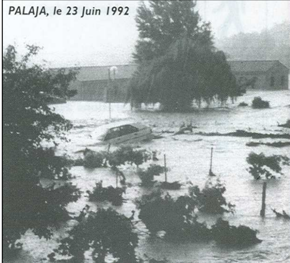
PALAJA, le 23 Juin 1992

Suite aux inondations catastrophiques de juin 1992, dont tous les Palajonais présents à ce moment là doivent se souvenir douloureusement, un certain nombre de travaux ont été réalisés pour remettre en état la commune dévastée.